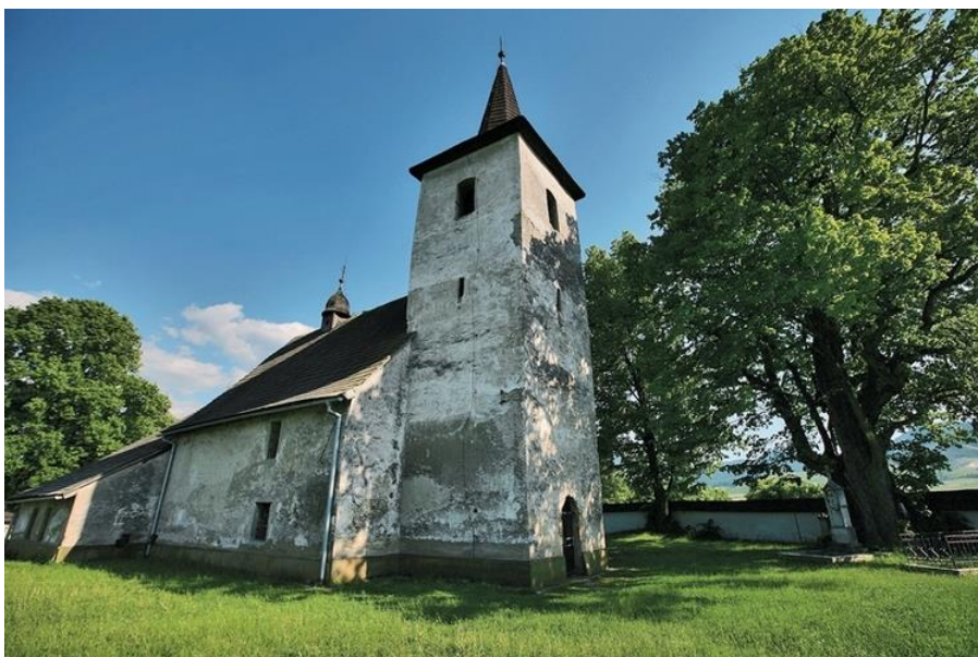
Kostolík v Ludrovej: Ukrýva hrob majstra templárskeho rádu?

Ďalšia povesť hovorí o ohnivom záprahu preháňajúcom sa v noci okolo kostola a mníchovi prenasledujúcom hriešnikov, ktorí sa v blízkosti Božieho stánku objavili. No a na Sviatok všetkých svätých - lebo práve im je zasvätený - sa tu stretávajú duše dávnych mŕtvych.