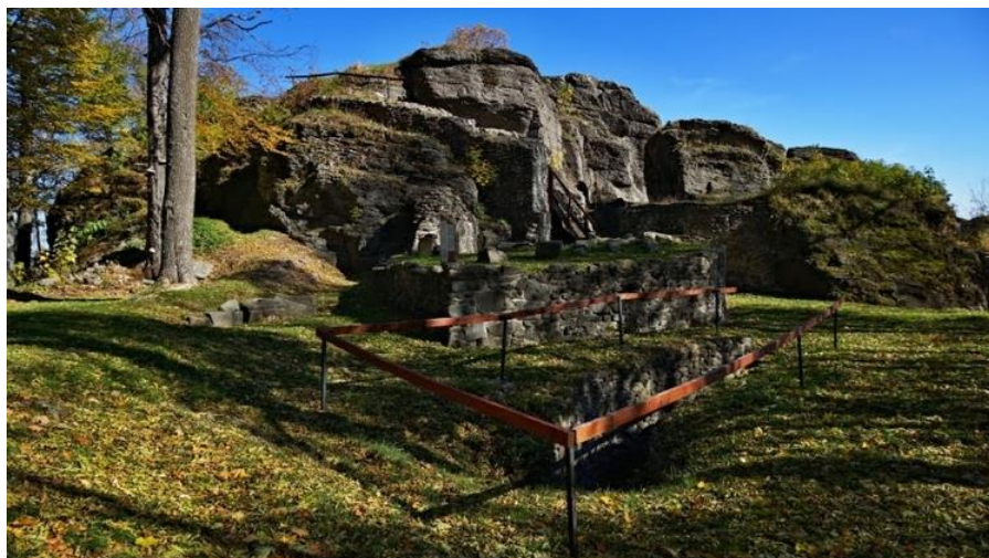
Ruiny: Z hradu zostali len zvyšky na úbočí Sitna.

Keď už psi súrodencov dobiehali, tí radšej skočili z brala, než aby hnili vo väzení. Nezomreli však, ale v skoku skameneli.