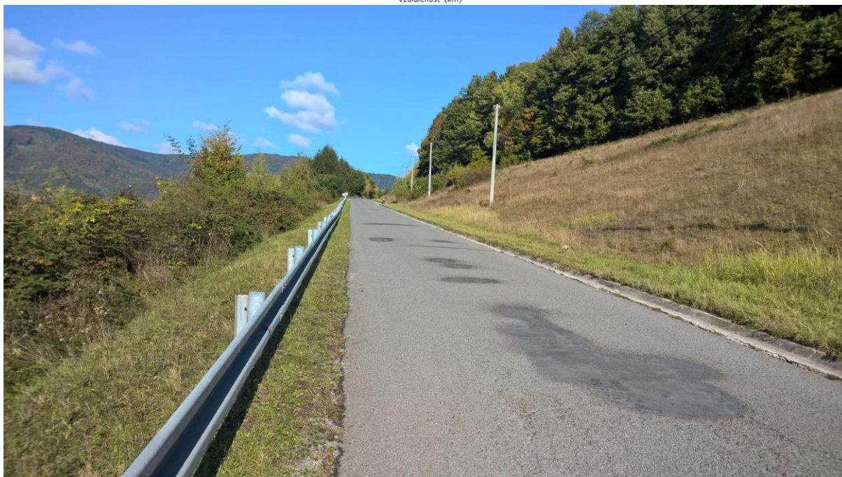
Kerametal-Prašivá-Kokava Háj-Drahová-Lom nad Rimavicou-Pršivá-Kerametal