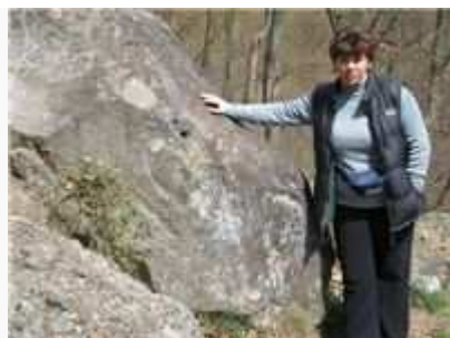
Trúbiaci kameň v Sucháni

Trúbiaci kameň – jedinečný výtvar prírody, alebo unikátny nástroj vytvorený ľudskou rukou, nevedno... dva otvory v jeho „tele“ dokážu vylúdiť tak silný a prenikavý tón, že sa rozlieha vo všetkých okolitých dolinách... ak si chcete vyskúšať zatrúbiť naň, stačí navštíviť obec Sucháň .