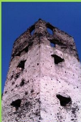
hrad Velký Kamenec