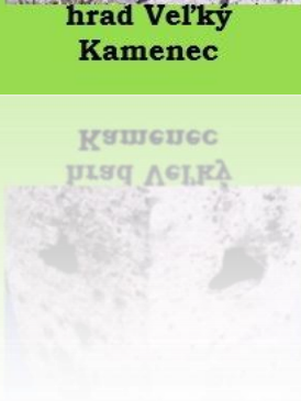
Kamenec hrad Velký