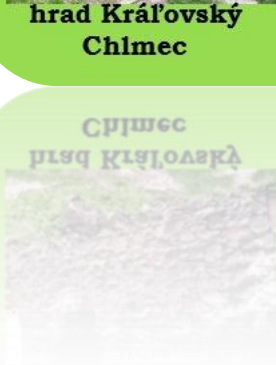
Chlmec hrad Královský