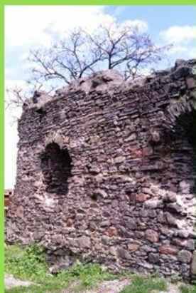
hrad Královský Chlmec