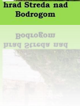
Bodrogom hrad Streda nad