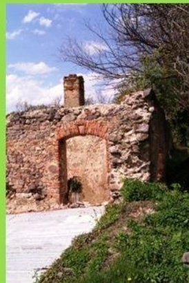
hrad Streda nad Bodrogom